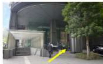
【B】駐車場入口側エントランス付近 (三菱UFJ信託ビル向かい)