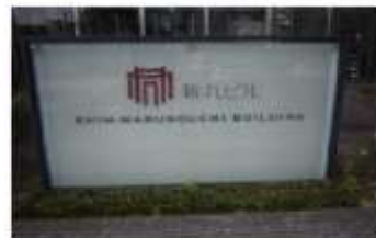
【C】新丸の内ビルディング ロゴマーク 周辺に、丸の内ビルディング、新丸の内センタービル、等 他の名称のビルがあるのでご注意ください。