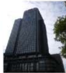
【A】新丸の内ビルディング 外観